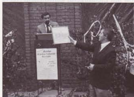
Überreichung des Fliesenbildes beim Richtfest Bürgerhaus Friedenshalle am 20. Juni 1987.

Für die musikalische Gestaltung des Richtfestes sorgten zusätzlich der