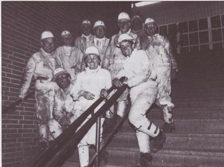
Die HVV-„Kumpels“

Als den Besuchern nach vier Stunden Untertageaufenthalt wieder das Tageslicht schien, freuten sie sich auf den traditionellen Umtrunk und die Dusche